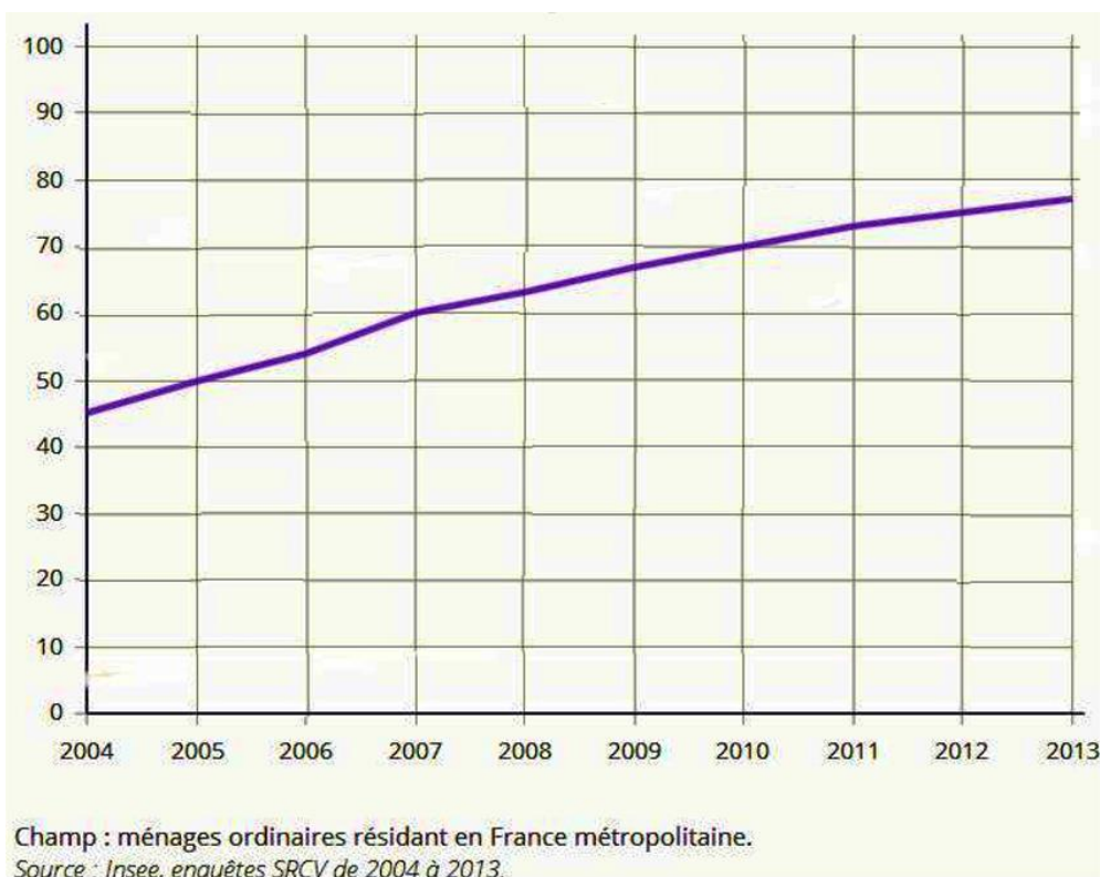
Document 2 : taux d'équipement des ménages en téléphone portable selon l'âge de la personne de référence.