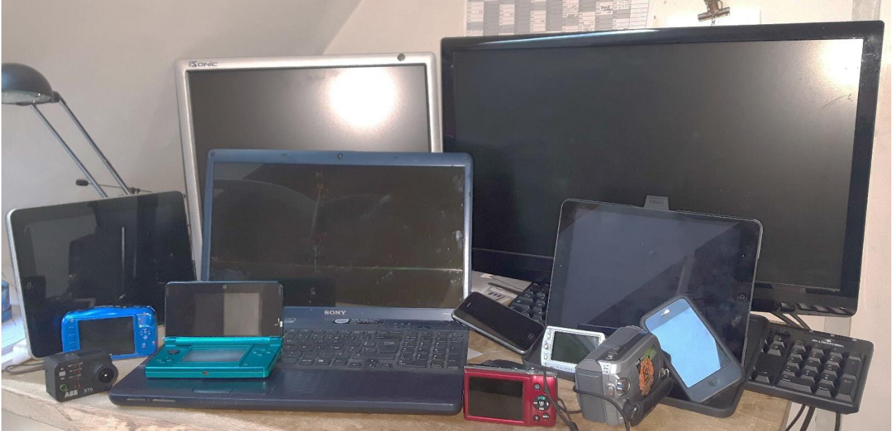
Photo prise avec le smartphone d'un des membres de la famille

Document 1 : équipement d'une famille (un couple avec trois jeunes enfants) se considérant peu victime de la société de consommation et moyennement connectée.