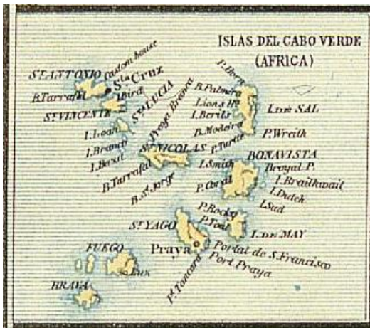
Carte de l'archipel établie en 1888.

De nombreux capverdiens ont quitté l'île, provisoirement pour embarquer sur des navires comme les baleiniers, ou plus durablement, dans les vagues d'émigration, vers les États-Unis notamment.