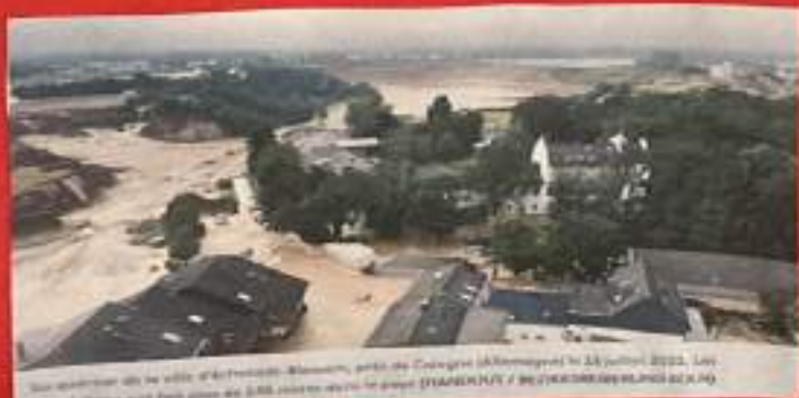
Sur le littoral de la ville d'Arles-sur-Oron, près de Cognac (France) le 14 juillet 2022. Les habitants ont fait plus de 200 mètres pour le projet

et pourra peut être des petit bout de terre avec des habitants.