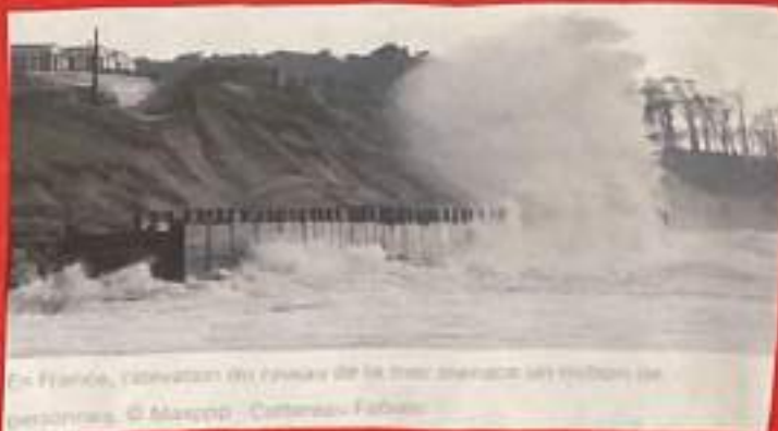
En France, réouverture des digues de la zone littorale des côtes de la Bretagne.