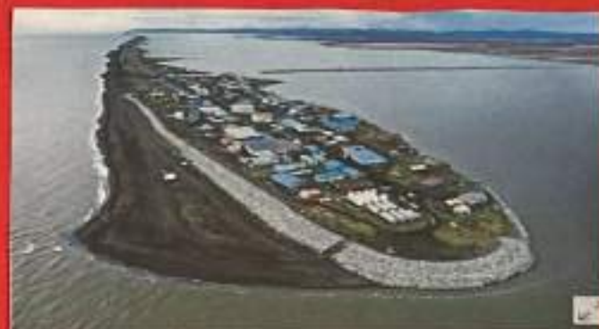
Le village de Kivalina, en Alaska, dans le cercle arctique, le 10 septembre 2019.

Depuis 1880, en raison du réchauffement de la planète, l'eau continue de monter.