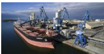
4 Port de commerce