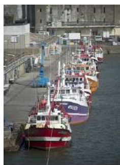
5 Port de pêche

2 – Après avoir présenté ce que sont les métiers de la mer, explique ce qui fait l'attractivité du port de Lorient.