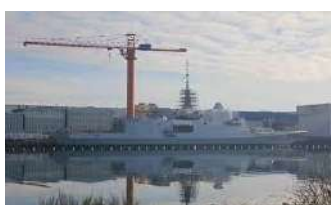
1 Port militaire