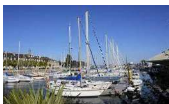
2 Port de plaisance