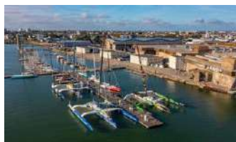
6 Port de course au large

1 – Indique pour chaque photo du document 1 la fonction du port présenté. A l'aide d'une carte, repère son emplacement sur la photo satellite puis reporte le numéro lui correspondant (tu peux aussi utiliser le document 3 de la recherche 1).