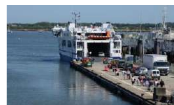
3 Port de passagers : Gare maritime