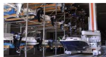
7 Port à sec